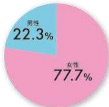
DATA 読者性別 ※2