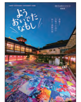
松山観光コンベンション協会様