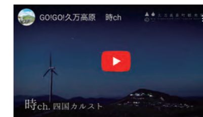
久万高原町様 時ch https://youtu.be/p1GbZRYK5M