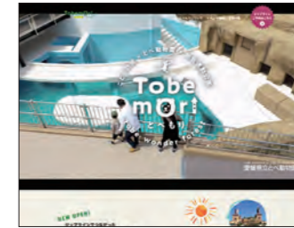
愛媛県様 とべもりWebサイト https://ehime-hajimarinomori.com

行政機関のニーズ(生活者支援、移住・定住促進、観光PR、販路拡大など)に応じ、企画・取材・編集・デザイン力を発揮し、行政とともに笑顔で元気な地域づくりのお手伝いをしています。