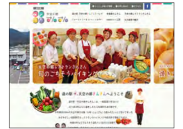
久万高原町様 天空の郷さんさん https://www.kumakogen-sansan.com