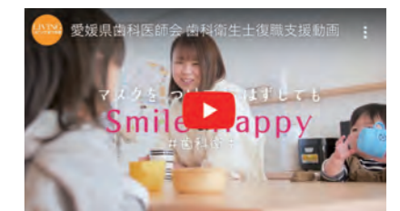
愛媛県歯科医師会様 歯科衛生士復職支援動画 https://youtu.be/dBVd1_2U7HM