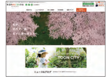
東温市様 移住・定住支援ポータルサイト https://toon-iju.com