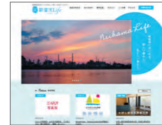
新居浜市様 新居浜市移住・定住支援ポータルサイト https://life.city.niihama.ehime.jp/