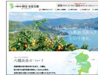
八幡浜市様 八幡浜市移住・定住支援ポータルサイト https://yawatahama-iju.com/