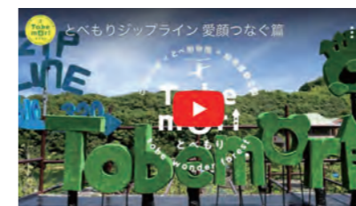
愛媛県様 とべもりジップライン 愛顔つなぐ編 https://youtu.be/0aR0esSAaRI